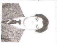
PROFESOR SERENIANO GENERAL